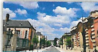
L'avenue de Champagne, à Épernay, symbole de l'essor du roi des vins dans le monde.

J-P.B.: Nous bénéficierons d'une formidable promotion auprès du